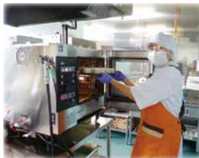
スペイン風 オムレツ