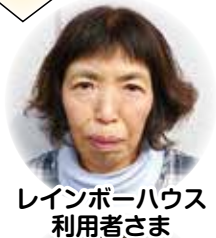
レインボーハウス 利用者さま

週2回、給食を注文し仕事以上に楽しみにしています。私は食事が大好きで、週2日は弁当を持ってこなくて済み、メニューもバラエティがあり、野菜も豊富に摂れます。調理師の皆さんにいつも笑顔を見せてもらい感謝しています。