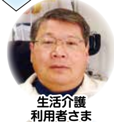
生活介護 利用者さま

栄養バランスを考えてあり、とても良い食事内容だと思います。素材の味もしっかり感じられます。日々の献立を考えられるのも大変と思いますが、これまで同様に利用者さんが喜ばれる食事の提供をして頂けたらと願っています。