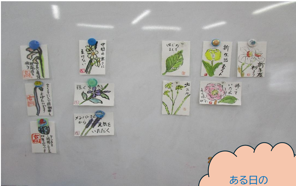
ある日の プログラム