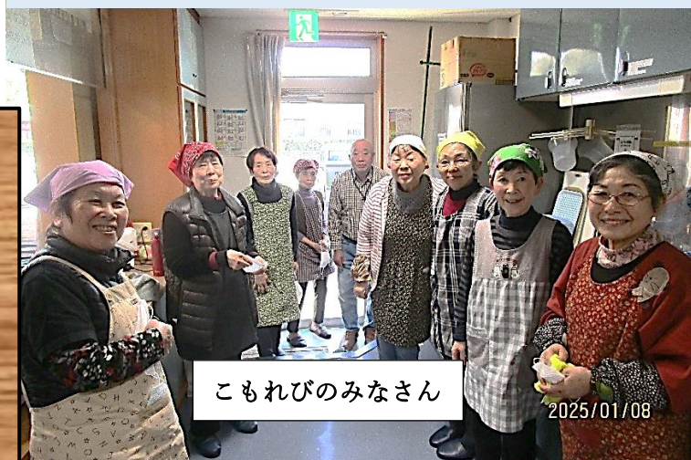
こもれびのみなさん

人口 10 万人あたり店舗数が最も多いのは本拠地がある島根県で 3.48 軒。以下、鳥取県、山口県、広島県、岡山県と中国地方が上位に並んでいる。意外性は、それほど、ない。